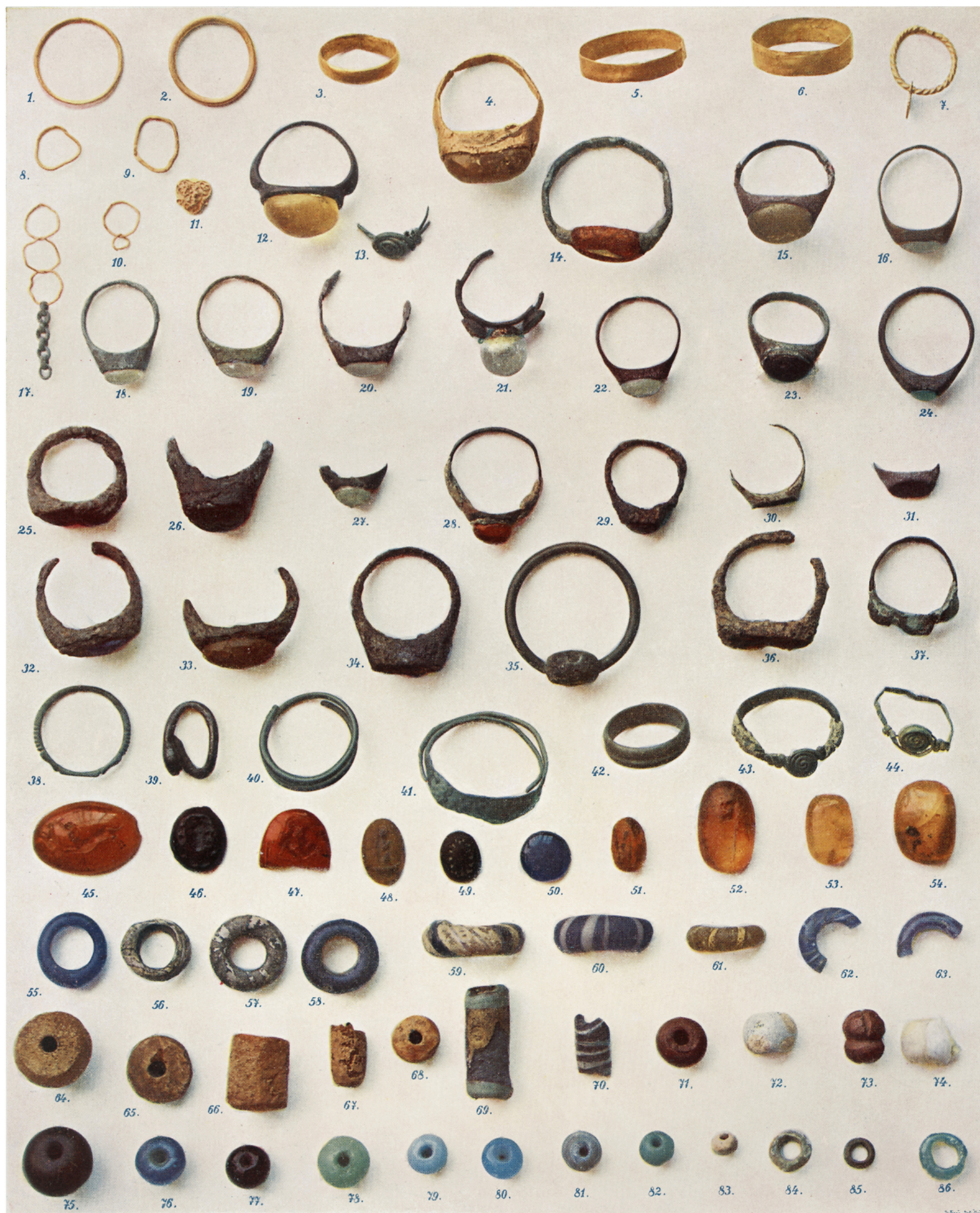
Prstény, kameny z prstenu, perle z jantaru a barevného skla (vel. 1/1).