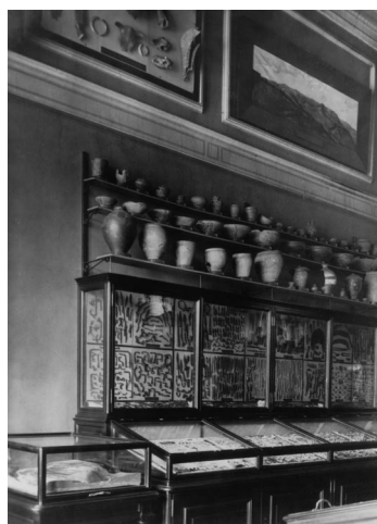
Původní vystavení nálezů ze Stradonic v Národním muzeu