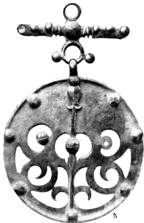
Obr. 7. Ozdobná závěska nalezená u Skrej blíž Podmokel z knížecího Fürstenberského musea na Krivoklátě.

Z hmotnějších ozdob již zcela do okruhu provinční římské kultury se hlásících můžeme uvésti pěkně profilované kování na tab. XII. č. 23. 26.—28., jež na spodní